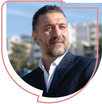
Giannis Fostiropoulos MAYOR OF PALEO FALIRO