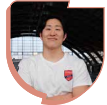
SUZUKI ΤΟΙ (D) 20/10/1999