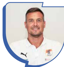
Norbert Hosnyánszky Team Leader